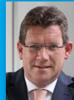
Dietmar Brockes MdB Sprecher für Wirtschaft, Industrie und Energie der FDP-Landtagsfraktion NRW