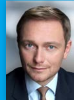
Christian Lindner MdB Vorsitzender der FDP-Landtagsfraktion NRW

Wir freuen uns auf den Dialog mit Ihnen.