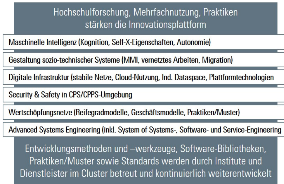
Bild 2: Sechs Leistungsbereiche stellen die Inhalte der Innovationsplattform