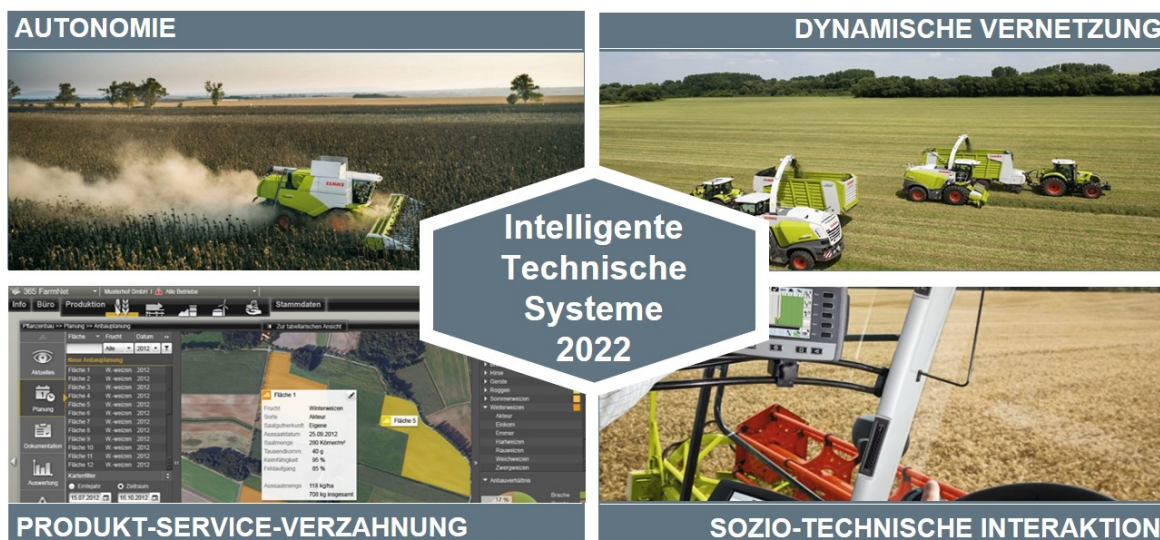
Bild 1: Technologieinduzierte Herausforderungen im Kontext intelligente technische Systeme

Bislang lagen im Fokus der Clusterprojekte sehr viele „maschinennahe“ Innovationen, wie z.B. intelligente Sensorik- und Aktoriklösungen oder Automatisierungskomponenten. Der Ausbau der Technologieführerschaft kann aber nur gelingen, wenn die Nutzenpotentiale durch informationsverarbeitende Prozesse inkl. kognitiver Funktionen erschlossen werden. Hier ergeben sich zukünftig vier neue technologieinduzierte Herausforderungen (Bild 1).